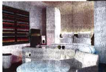
Au Gabriel (XI e), un programme spécial associe lumière et musique pour un séjour régénérant.

A compter du 12 avril (et jusqu'au 30 juillet), l'Hôtel de ville accueille en sa salle Saint-Jean une exposition consacrée à « Paris au temps des impressionnistes ». La ville fut en effet source inépuisable d'inspiration pour les architectes, jardiniers et peintres, Claude Monet, Degas, Toulouse-Lautrec, Renoir, Fantin-Latour, Vuillard et tant d'autres. Quelque 135 documents et œuvres dont