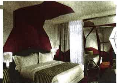
Inspiration rouge et lignes brisées au Cristal (VIII e ).

Une quarantaine d'adresses singulières ont récemment ouvert dans la capitale. Elles ajoutent au plaisir du séjour celui d'un parti pris très stylé.